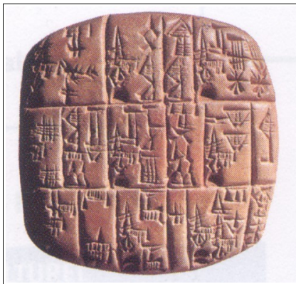
Invention : écriture