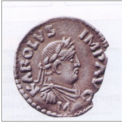
Nom : Charlemagne Année : 800

1) Retrouvez les personnages historiques ainsi que leurs actions