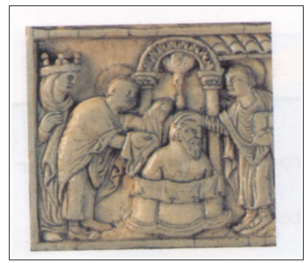
Nom : Clovis Année : 496