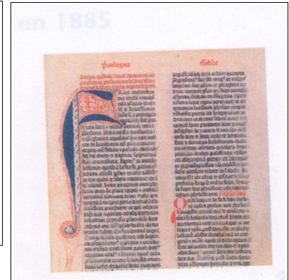
Invention : imprimerie