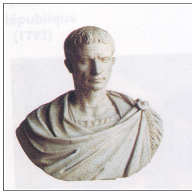
Nom : Jules César Année : 52 av J.C