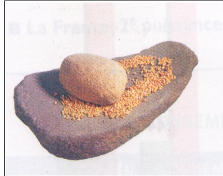
Invention : agriculture